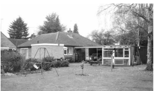
レスターにあるデビー先生の実家。「広い庭など、遊ぶためのスペースが豊富で、私たち兄弟はとても幸せだったわ」と先生。

私の経験上、伝統的なイギリス料理をリーズナブルな価格で食べられるレストランを見つけるのはとても大変です。本当に美味しいイギリス料理とは、家庭料理のなかにこそあります。